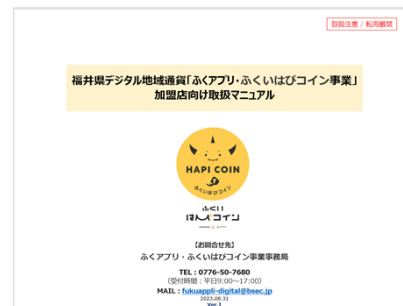
⑤取扱マニュアル (本誌)