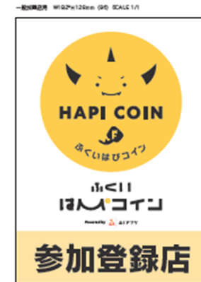
④ステッカー (一般店舗用)